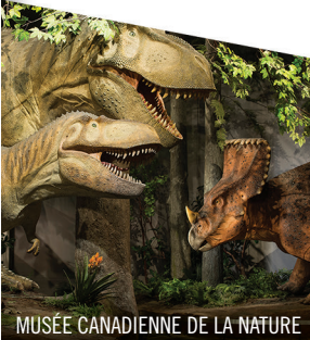
MUSÉE CANADIENNE DE LA NATURE

Forfaits touristiques familiales comprennent des laissez-passers au Musée de la nature.* Suites familiales a partir de 109$. *