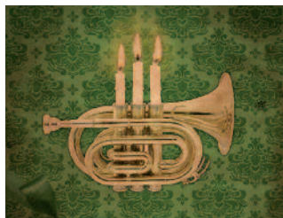
Art: Lama Communications Group

DEC 15 DÉC 2016 | 19:30 DEC 16 DÉC 2016 | 19:30