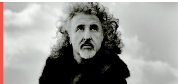
MISCHA MAISKY.