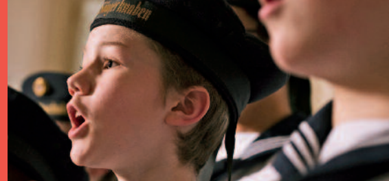
VIENNA BOYS CHOIR. PHOTO: LUKAS BECK