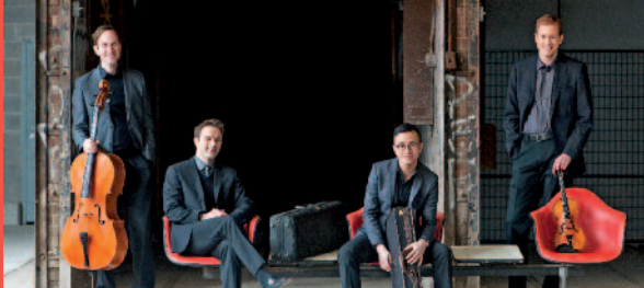
NEW ORFORD STRING QUARTET.