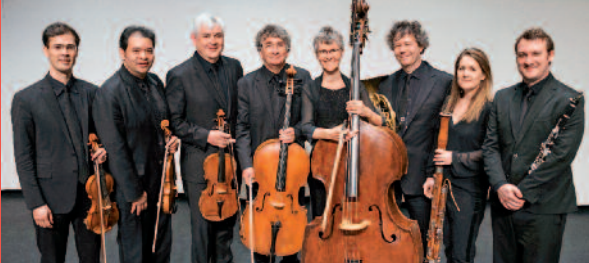
ACADEMY OF ST MARTIN IN THE FIELDS.