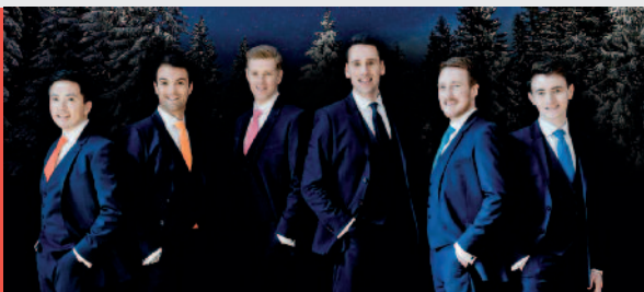
THE KING'S SINGERS GOLD.