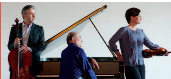
GRYPHON TRIO. PHOTO: BO HUANG