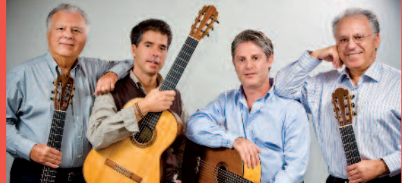
ROMERO GUITAR QUARTET.