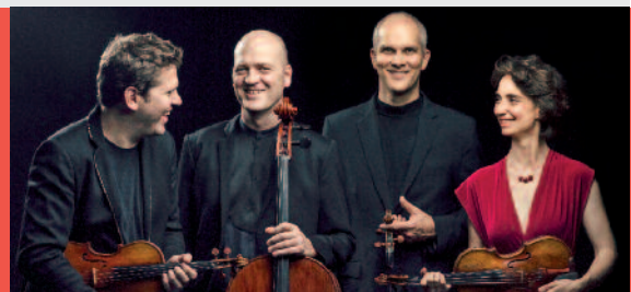
CUARTETO CASALS.