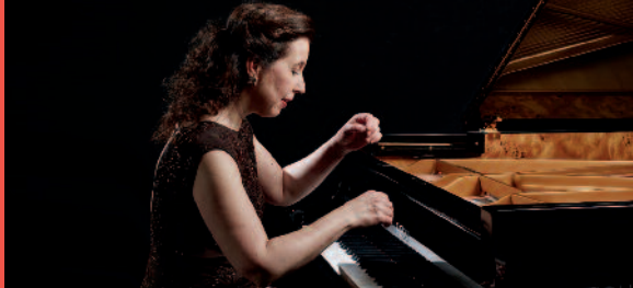
ANGELA HEWITT. PHOTO: BERND EBERLE